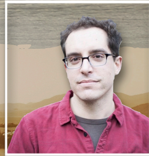
作曲家 Felipe Pinto d'Aguiar (智利)